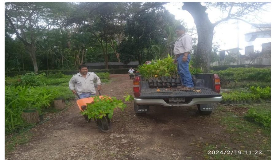
Entrega de plantas en vivero.